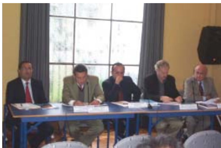
Seminario "Control Democrático del Sistema de Inteligencia".