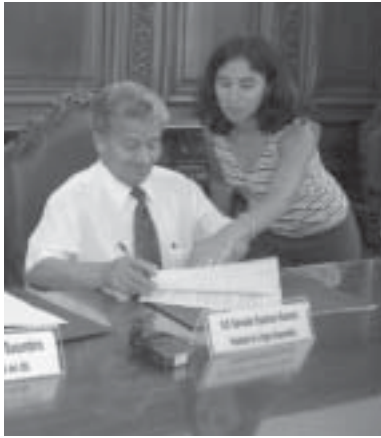
Firma de convenio con el gobierno regional de Huancavelica.