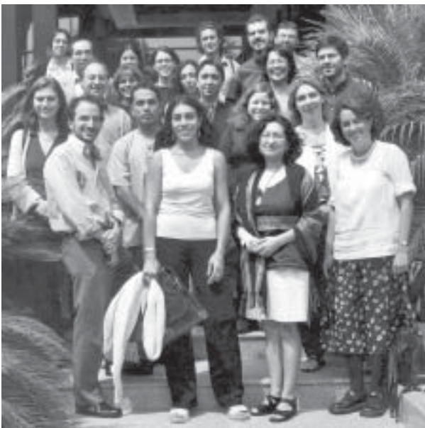
Reunión de diversos organismos de derechos humanos de Brasil, Argentina, Colombia, Chile y Perú.