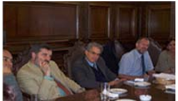
Diálogo con Lord Alderdice sobre violencia política en Irlanda del Norte.