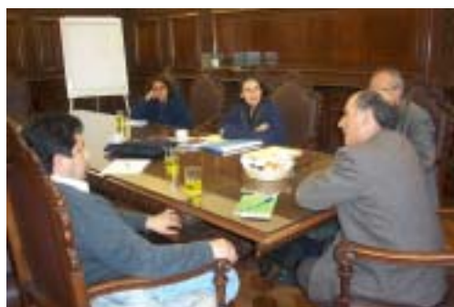
Mesa de trabajo sobre "Jurisdicción comunal y rondas campesinas".