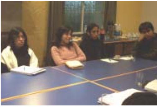
Reunión con dirigentes estudiantiles sobre avances y retrocesos de la lucha anticorrupción.