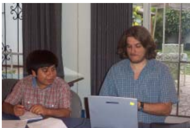
Visita de consultores internacionales para el desarrollo de las comunicaciones del IDL.