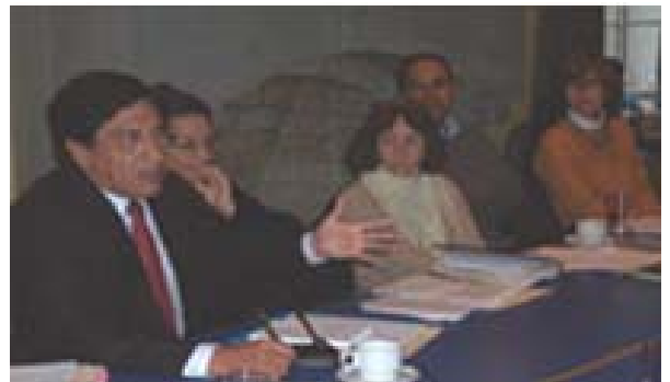
Desayuno de trabajo "Intervenciones en casos de violencia y abordaje de lo subjetivo".