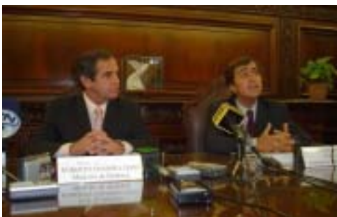
Firma de convenio entre el Ministerio de Defensa y el IDL.