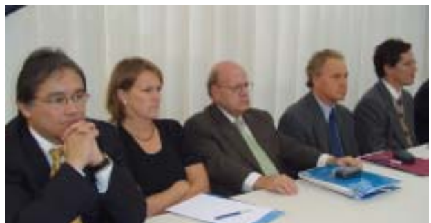
Mesa de trabajo sobre los avances de la Comisión Especial de Reforma Integral de la Administración de Justicia (Ceriajus).