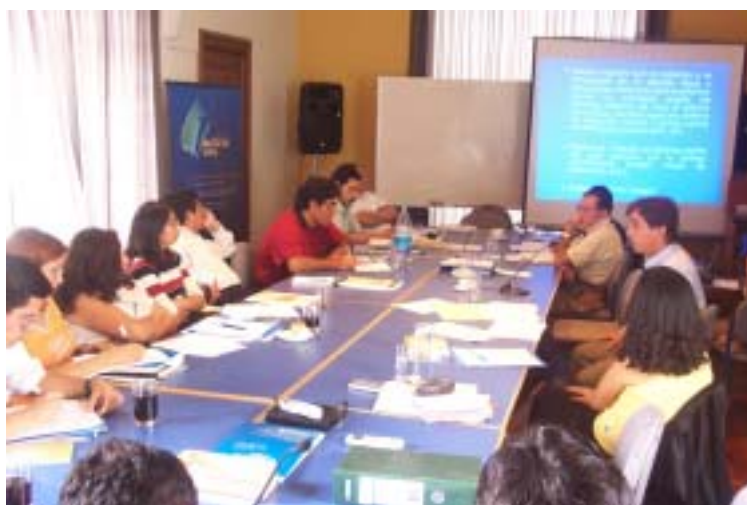
Taller de evaluación y planificación de Justicia Viva con las instituciones que integran el proyecto a nivel nacional.