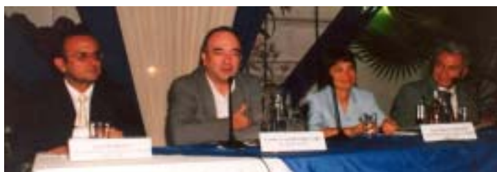
Presentación de los dos libros del IDL sobre Democracia y Fuerza Armada: Bases para un control civil democrático de la Fuerza Armada del Perú y Transparencia y eficacia en gastos para la defensa .

Se nos está cumpliendo un deseo de "juventud institucional": tener un local que nos permite realizar permanentemente todo tipo de actividades, sin que haya necesidad de detener el trabajo habitual. Hay días en los que el local soporta paralela o sucesivamente un taller para líderes de diferentes partes del país; la presentación de un libro; el encuentro de un grupo de defensoras comunitarias; el intercambio de opiniones con policías, jueces, fiscales o militares; una mesa con expertos de alto nivel; la firma de un convenio; un seminario internacional y, al final, como corresponde, la celebración de la jornada. Encuentro de diferentes sectores, temas, edades, lugares y posiciones, unidos por algunas convicciones comunes. Está usted invitado.