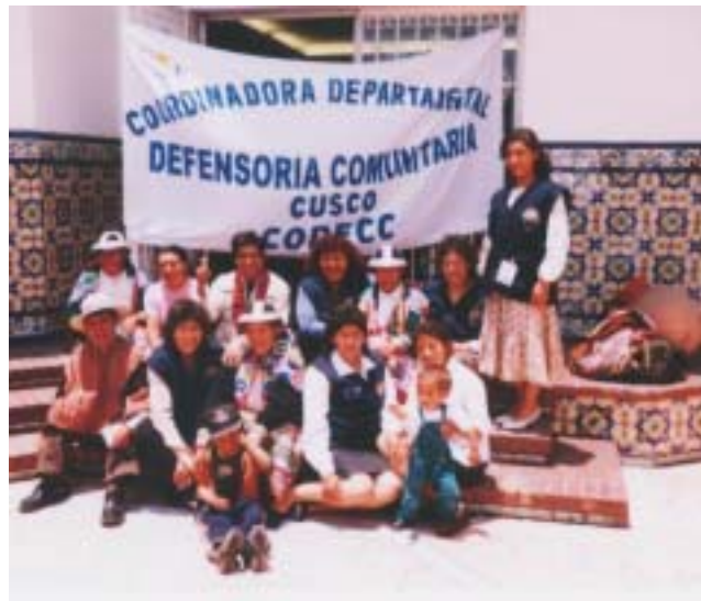
Visita de defensores comunitarios del Cusco con quienes tenemos ya un vínculo de varios años.