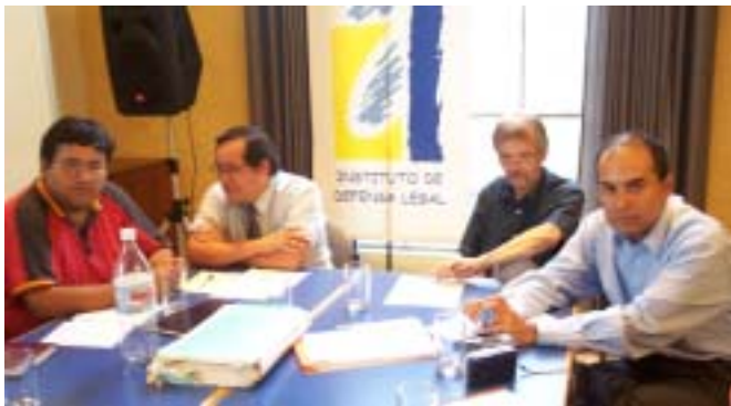
Diálogo sobre Derecho Indígena y Justicia en los Andes con instituciones de diferentes partes del país y la región.