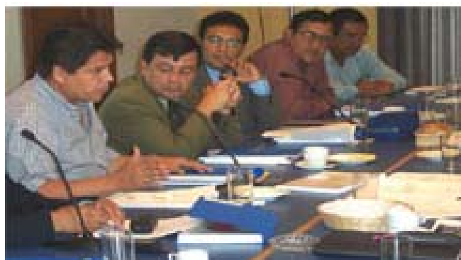
Conversatorio con alcaldes sobre los Comités Distritales de Seguridad Ciudadana.