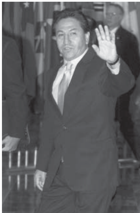
Y nuestro Alejandro Toledo.

Los gobiernos de los países centroamericanos esperan que el Congreso de Estados Unidos ratifique el Tratado Centroamericano de Libre Comercio en el 2005. Pero será una lucha dura. En forma semejante, un acuerdo de libre comercio de Colombia, Ecuador y Perú con Estados Unidos también enfrentará una recepción escéptica en un Congreso bastante proteccionista. Las negociaciones para el Acuerdo de Libre Comercio para las Américas (FTAA) continuarán languideciendo. Ni el Brasil ni los Estados Unidos tienen mucho interés en revivirlas. Ambos países pondrán sus principales esfuerzos en las conversaciones multilaterales de la Ronda de Doha de la Organización Mundial de Comercio. En noviembre los líderes del hemisferio se reunirán en Buenos Aires para una nueva Cumbre de las Américas. Probablemente no llegarán a ningún acuerdo nuevo