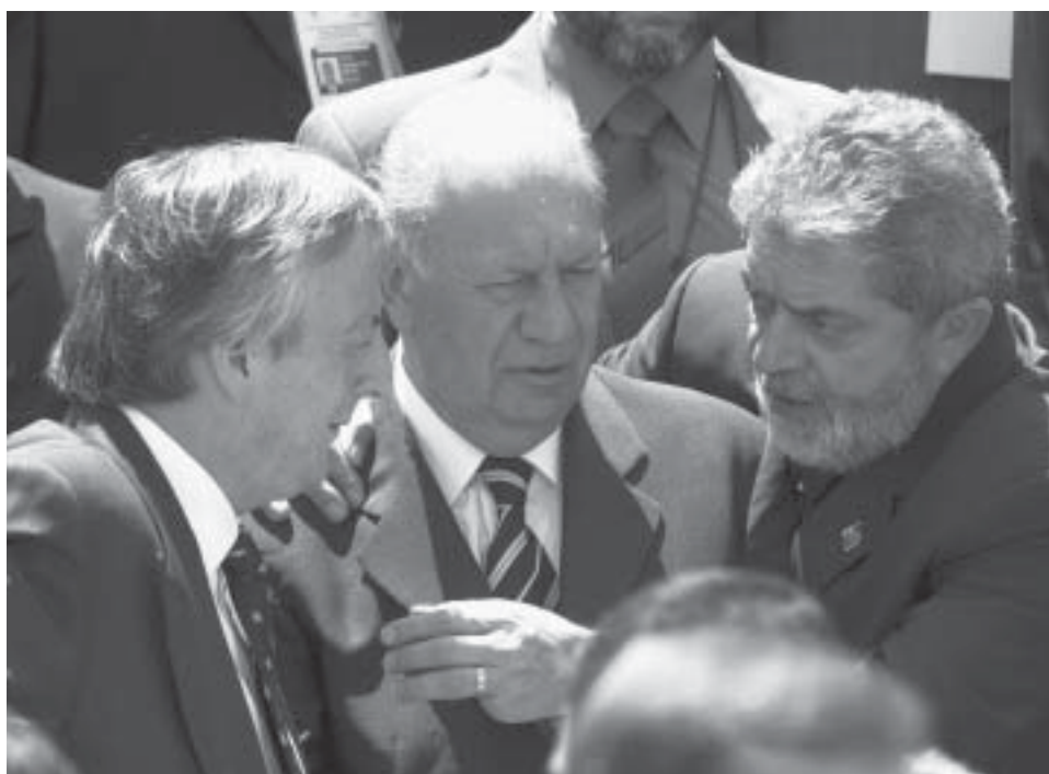
Kirchner de la Argentina, Lagos de Chile y Lula del Brasil.

proceso de crecimiento sostenido. Eso pasa por un incremento en la tasa de inversión, que, a su turno, requiere mayor esfuerzo en las reformas microeconómicas, tan postergadas en los últimos años.