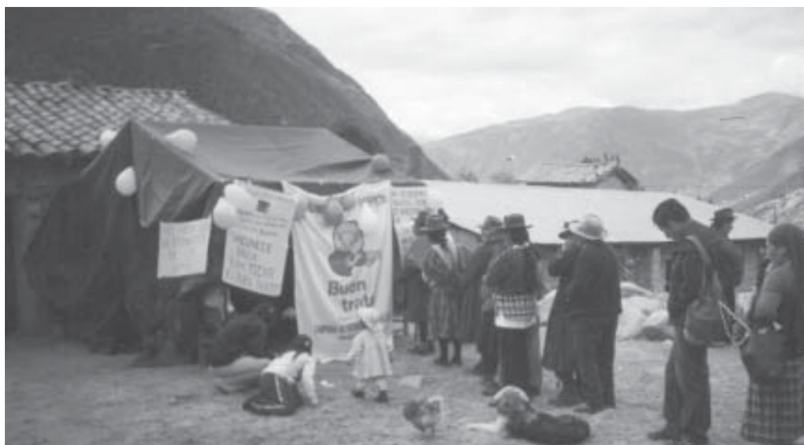
Justo Apu Sahuarahua. Brigadistas y defensoras entusiastas implementando el puesto de vacunación del distrito de Justo Apu Sahuarahua, provincia de Aimaraes, región Apurímac.

El IDL es parte del Pacto por el Buen Trato, organización conformada por varias ONG (además del IDL, Vichama Teatro, Asociación Kallpa, Kusi Warma, Save the Children, Sumbi, Cedapp, Cesip, Eduvida y Acción por los Niños) reunidas gracias a la iniciativa de