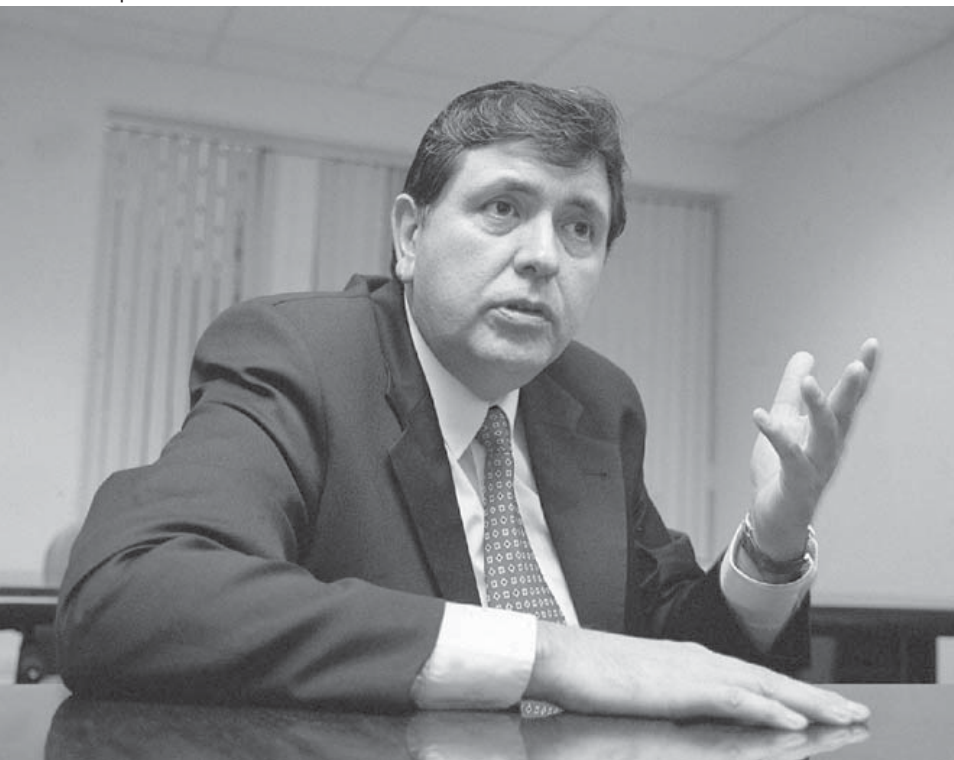
El pasado de Alan García debe ser parte del debate electoral y decisivo a la hora de votar.