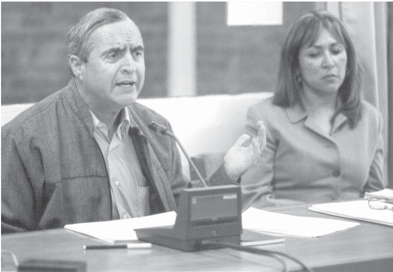
Todo esfuerzo contra el crimen organizado solo tiene sentido si forma parte de un sistema anticorrupción.

expedir el dictamen correspondiente; y porque los juicios orales duran una eternidad: farragosos e inconducentes interrogatorios, innecesaria suscripción de actas, etcétera.