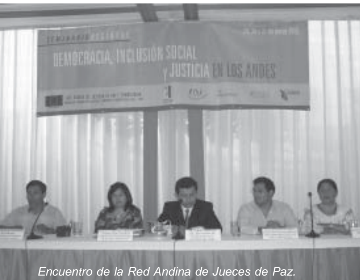
Encuentro de la Red Andina de Jueces de Paz.