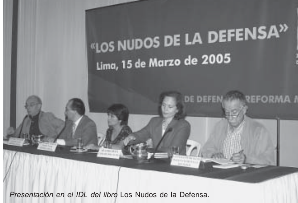
Presentación en el IDL del libro Los Nudos de la Defensa.

"Un proceso electoral que comienza", en el que son muchos y muchas las organizaciones y personas que ya han demostrado estar dispuestas a todo con tal de ganar el codiciado e importantísimo poder político. Desde ponerse y