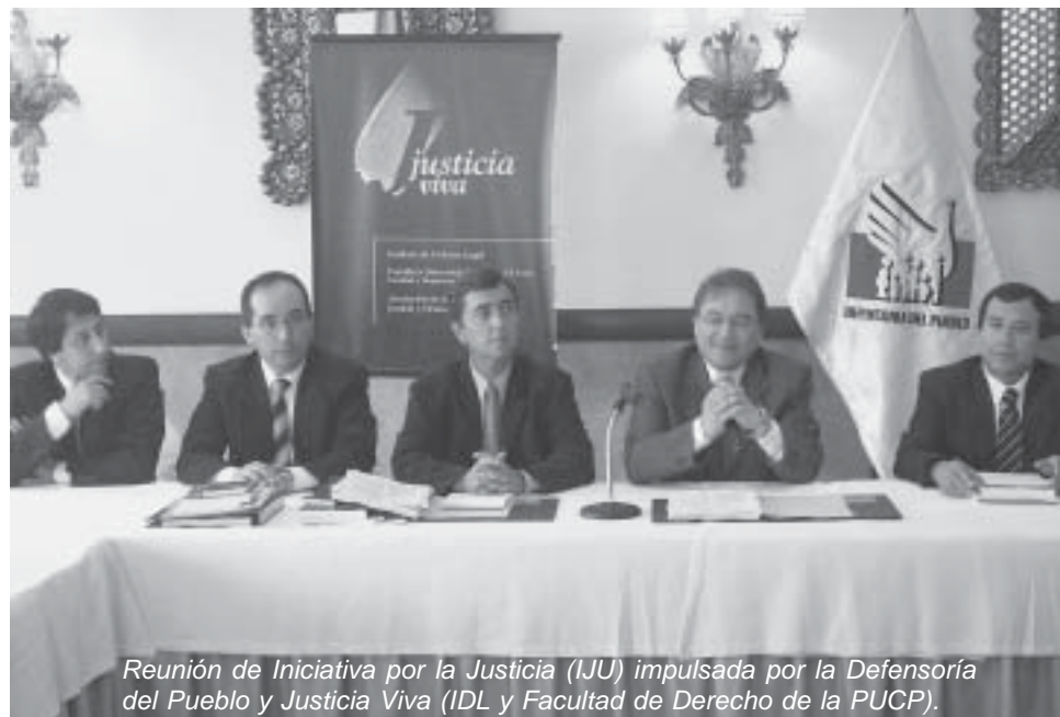
Reunión de Iniciativa por la Justicia (IJU) impulsada por la Defensoría del Pueblo y Justicia Viva (IDL y Facultad de Derecho de la PUCP).

quitarse cualquier camiseta (siempre en nombre de una causa noble), hasta hacer todo tipo de méritos, acuerdos, ofertas y giros sobre la base de convicciones pero también de —la real politik — conveniencias, encuestas, demandas o humores y malos humores sociales.