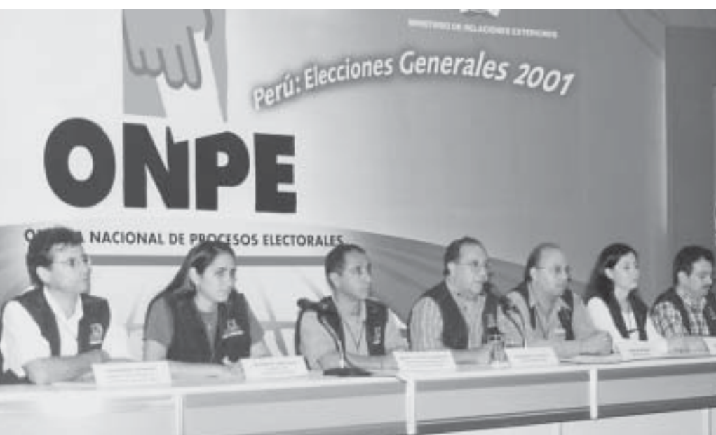
El autor (cuarto de izquierda a derecha) cuando estaba al frente de la ONPE, donde desarrolló una elogiada gestión.

Para poder superar con éxito todo este enmarañado, complejo y superpuesto plan de procesos electorales, será necesaria una adecuada y oportuna asignación presupuestal, un nuevo Código Electoral y una demostración de imparcialidad y eficiencia de los organismos electorales. ■