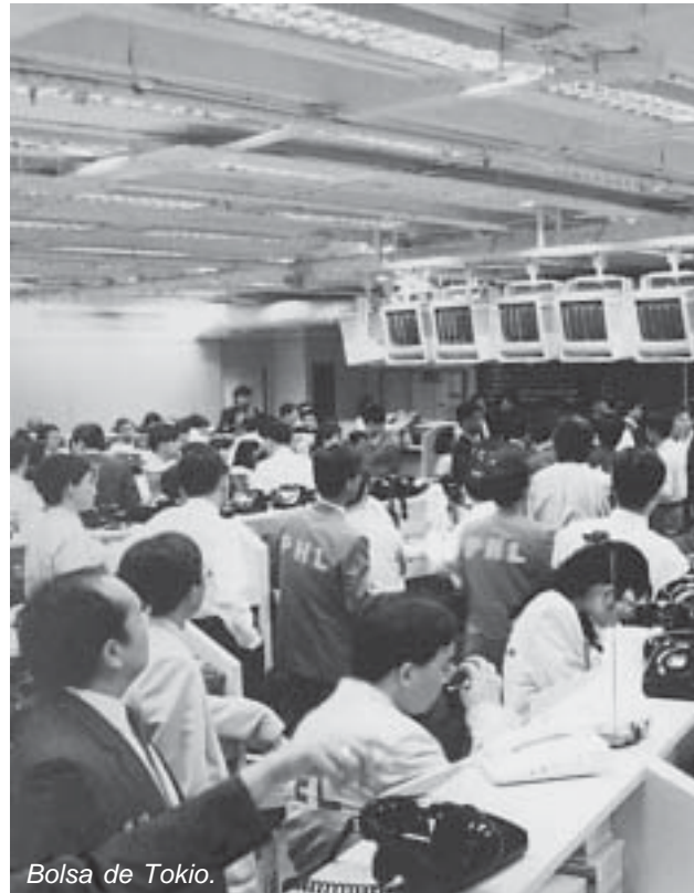
Bolsa de Tokio.