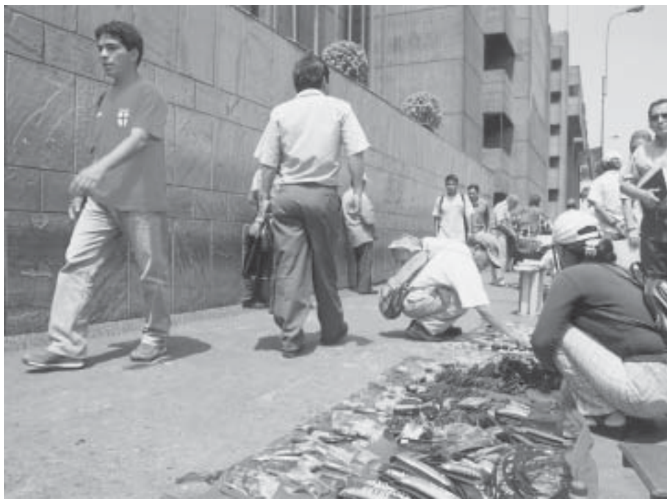
En el Perú, en la década de 1990 los niveles de informalidad se incrementaron desde el 52,7 por ciento al 56,2 por ciento.