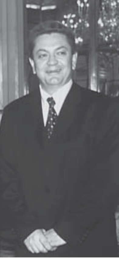
Nicolas Sarkozy (al centro), nuevo líder de la Unión para un Movimiento Popular, partido que agrupa a la mayor parte de la derecha francesa.

Nicolas Sarkozy no es Napoleón, pero comparte con el genial General dotes de trabajador incansable y de hábil comunicador social, así como la firme convicción de que es posible vencer, por medio de la acción política, obstáculos que la mayoría juzga insuperables.