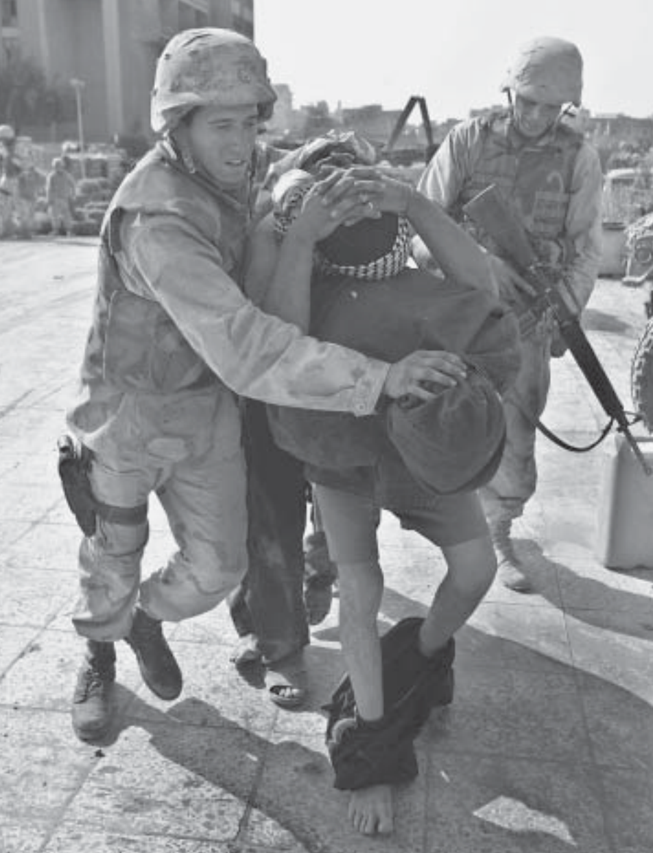
Irak. Los Estados Unidos "creen que el derecho es un impedimento para ganar la guerra contra el terrorismo".

ten el DIH. El único mecanismo es hablar con ellos. Por ejemplo, podría negociarse un "código de conducta" por el que se comprometan a respetar el DIH, pero también otorgarles la posibilidad de tener tribunales para juzgar a los miembros infractores. Como juristas vamos a decir que esto no es posible, porque los tribunales deben estar basados en las leyes y los grupos armados no pueden hacer leyes. Sin embargo, el artículo 3 común a los Convenios de Ginebra dispone que "[...] en caso de conflicto armado no internacional para cada una de las partes se