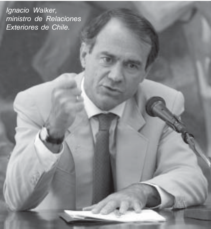
Ignacio Walker, ministro de Relaciones Exteriores de Chile.