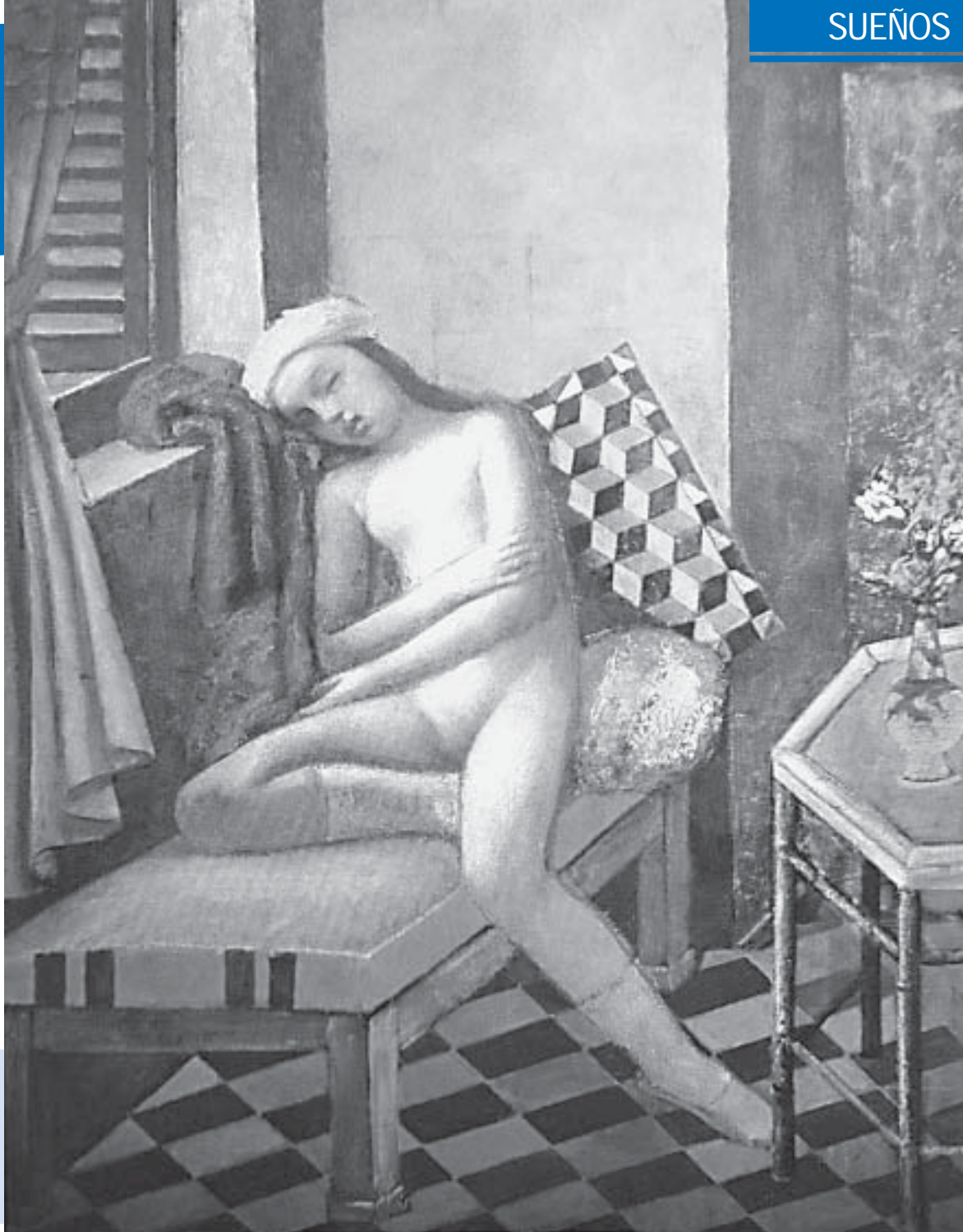
Balthus. Nu assoupi.