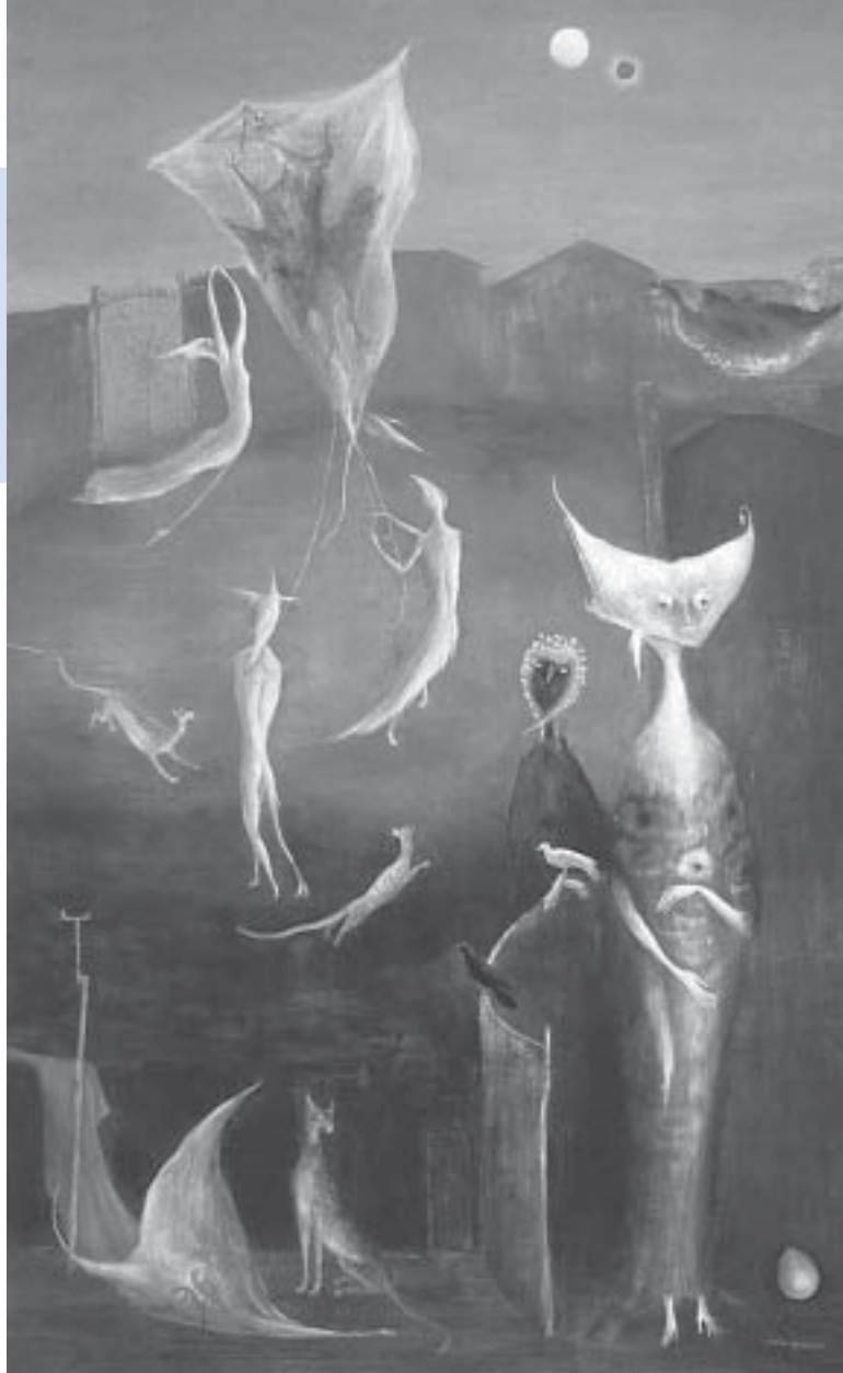
Leonora Carrington. Samain .

Cuántas veces sentimos alivio porque nos despertamos luego de un sueño angustiante y alejamos de nosotros imágenes indeseables o tan interesantes que nos asustan. Al mismo tiempo, y en tiempos diferentes, abrazamos el alivio porque justamente podemos soñar proyectando algunas ilusiones que nos salvan del acomodamiento y la inercia a los que nos atamos muchas veces en vida. El sueño, en fin, aparece desafiando la finitud y dibujándole tal vez alternativas a la muerte.