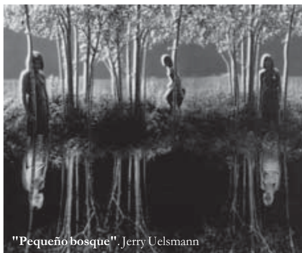
"Pequeño bosque". Jerry Uelsmann

Los ajetreos del presente dedican resquicios insignificantes a la exploración de las praderas oníricas, una franja prácticamente vedada al urbanícola contemporá-