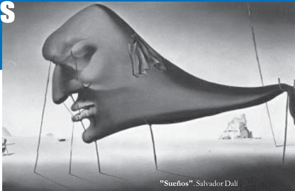
"Sueños". Salvador Dalí

Como anunciamos en la edición anterior, dado que casi todos nuestros invitados cumplieron con nuestro encargo de contar e interpretar sueños escuchados, leídos o vividos, presentamos la segunda parte, tan expresiva como la primera. Y habrá sueños III, en la próxima edición.