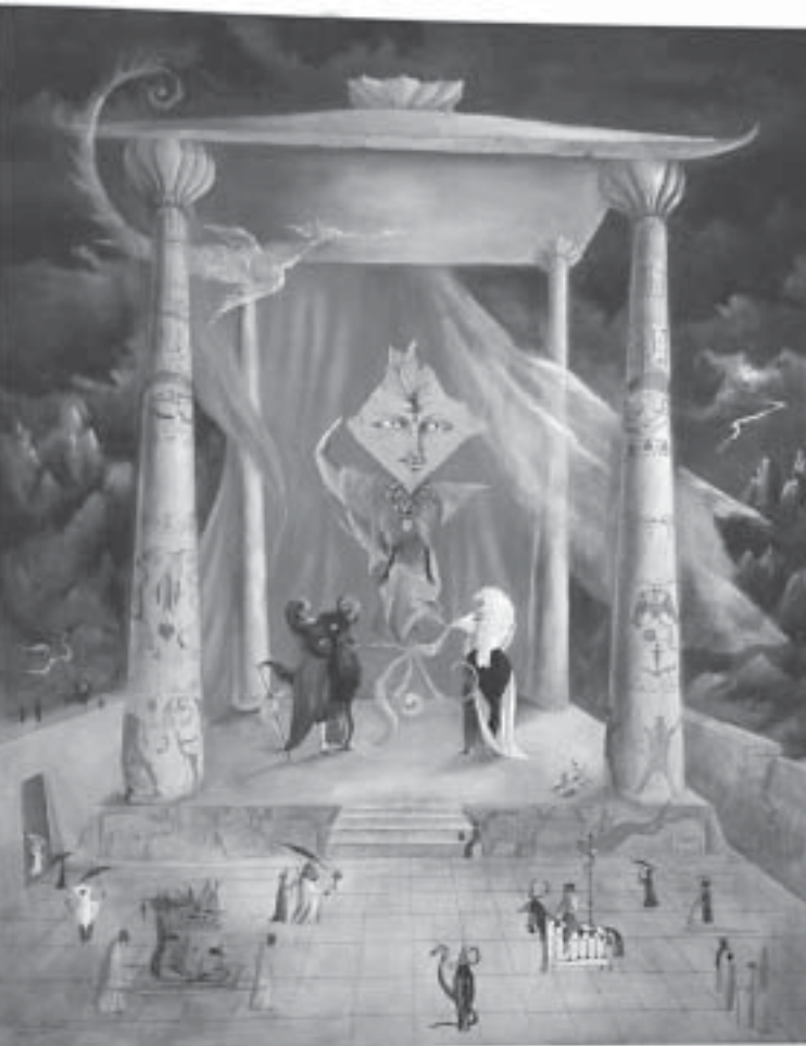
"Temple of the Word". Leonora Carrington

Acabo de despertarme y recordar un sueño. Y me doy cuenta de que el sueño era igual a lo que suelo considerar la 'realidad' en la vigilia. ¿Acaso cuando soñaba eso no me parecía real? Como Chuang Tse, el sabio taoísta chino que soñaba ser una mariposa. Y al despertarse se preguntó: "¿No seré más bien una mariposa que sueña ser Chuang Tse...?". ¡Estoy comenzando a darme cuenta de que lo que vivimos es un sueño! —No es "como" un sueño. Es un sueño—. ¿La actitud de la gente no es muchas veces como la de los personajes de un sueño? Su conducta es bizarra, y algunos de sus cuerpos son hasta grotescos. También a veces el cómo se visten, cómo actúan, bizarramente. ¿Nuestra vida acaso no es bizarra? Mira a los personajes de la vida "real". ¿No son bizarros? Cómo actúan, cómo piensan, hasta sus muecas; incluso cómo se visten. Ahora me parecen como los personajes de un sueño. Mírate. ¿Tu conducta no es de lo más bizarra acaso? ¿No haces cosas raras? ¿No te encuentras haciendo o diciendo cosas rarísimas? ¿Cosas que ni pensabas? ¿No eres acaso sino el personaje de un sueño, que se cree "real"? ¡Exactamente como en un sueño! Entonces, ¿por qué te tomas tan en serio? ¿Por qué tomas tan en serio las cosas que te pasan? ¿Por qué le das tanta importancia al sufrimiento (y al placer)? Despierta... Tan solo goza el sueño —este, el de la vida— como Sueño... y Plenitud. ■