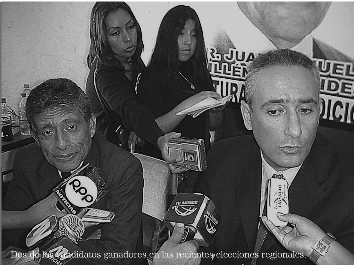
Dos de los candidatos ganadores en las recientes elecciones regionales.

ras partidarias, pero, sobre todo, se instaló la política local, cuando no tribal.